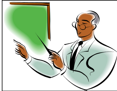
圖 1 說明

儘可能用清楚之製圖或電腦輸出圖，避免複印易失真圖片。圖表說明字體及表內容字體均以與內文相同之字體繕打。